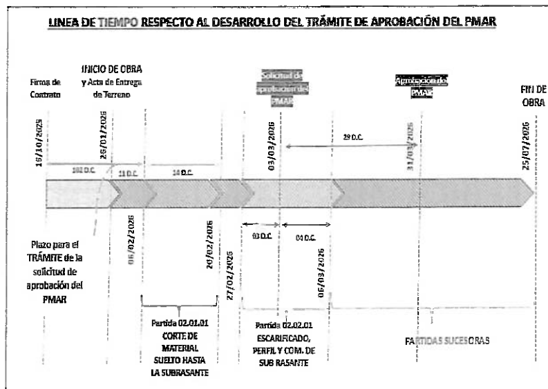
Imagen 01: Línea de tiempo respecto al desarrollo del trámite de aprobación del PMAR