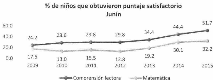
Gráfico N° 3