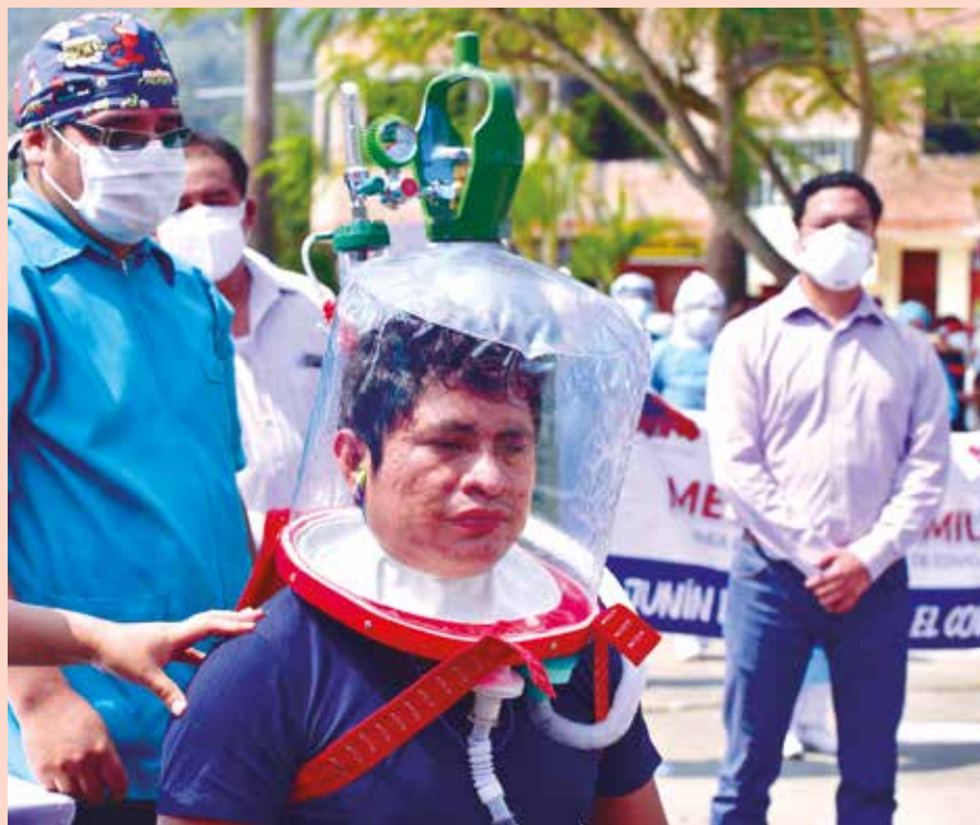
»Los cascos Helmet frenaron el contagio a otros pacientes y al personal médico.

Esto crea un impulso para el sistema inmunológico del que padece la enfermedad y puede ayudar a acelerar su proceso de recuperación. El 80% de los pacientes que recibie-