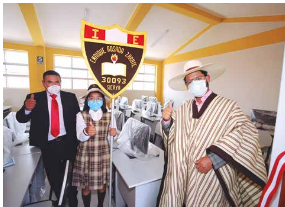
»»La infraestructura educativa cuenta además con equipamiento moderno.

Mientras que en Ahuac el GRJ invirtió S/ 1,264,267.23 y consta de dos aulas pedagógicas, sala de