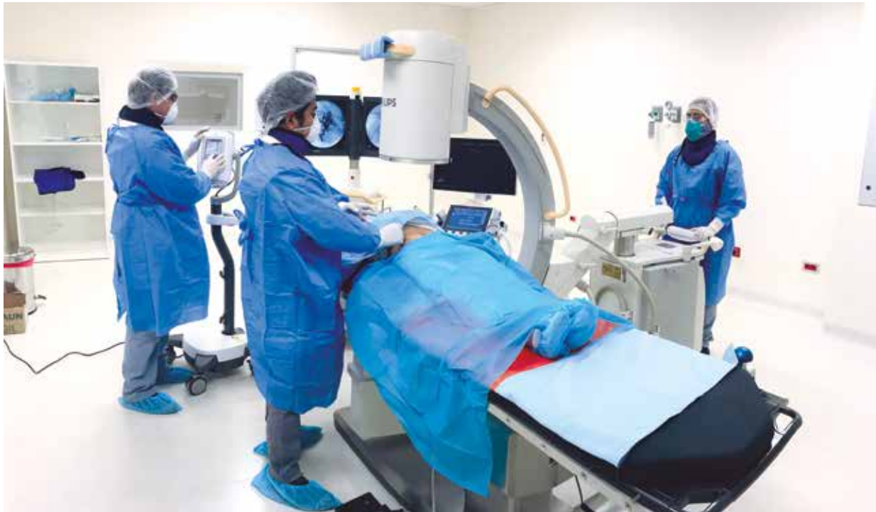
➤El IREN Centro realiza tratamiento especializado a pacientes de varias regiones.