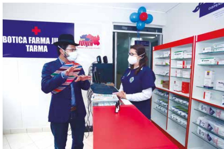
»Gobernador regional indica la calidez que debe darse en las atenciones.