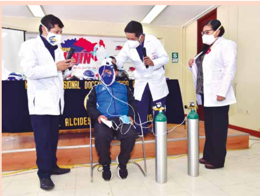
»La región Junín masificó su utilización para evitar más contagios.