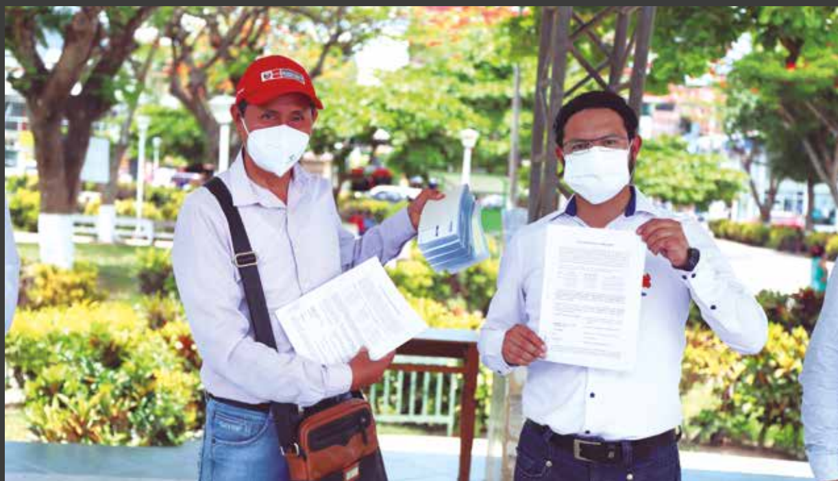
➤El alcalde de Pichanaqui recibió los vales para dotación de combustible.

100 KILÓMETROS DE VÍAS RECIBIRÁN MANTENIMIENTO