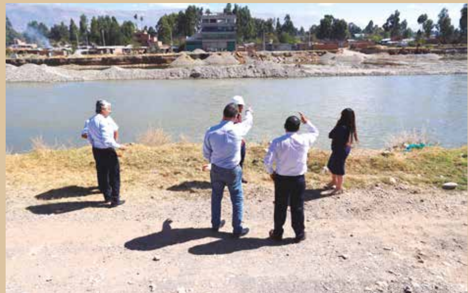
➤ El Comunero III unirá los distritos de El Tambo y Pilcomayo.

EL MÁS EMBLEMÁTICO ES EL COMUNERO II EN HUANCAYO