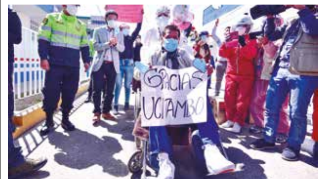
➤Familiares los reciben felices al verlos recuperados.