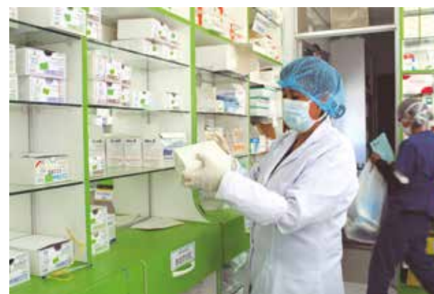
➤ Junín es la única región del centro del país en obtener excelente calificación.

para dotar de medicamentos a los nosocomios para el tratamiento de todo tipo de males, permitieron alcanzar esta ubicación, mientras que los pacientes no tienen que acudir a las farmacias.