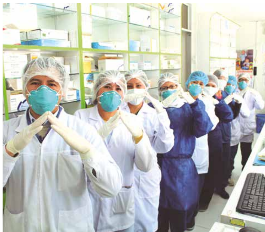
➤ Dotación de medicamentos permite atender a pacientes de escasos recursos.

Los esfuerzos realizados por el Gobierno Regional de Junín a través de la Dirección Regional de Salud,