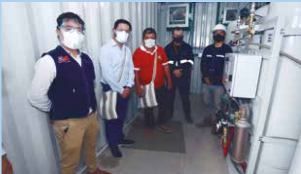
»» La Selva Central no padecerá de oxígeno y no dependerá de monopolios.