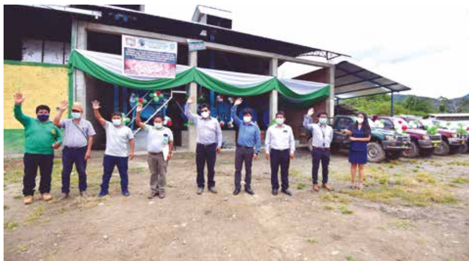
➤Caficultores ya pueden producir café de alta calidad y a bajo costo.

Ambas cadenas productivas que ya vienen trabajando fueron ganadoras del Procompite Regional, por lo que la entidad les hizo entrega de equipos como máquinas rotatorias de 80 quintales, guardiolas, pila-