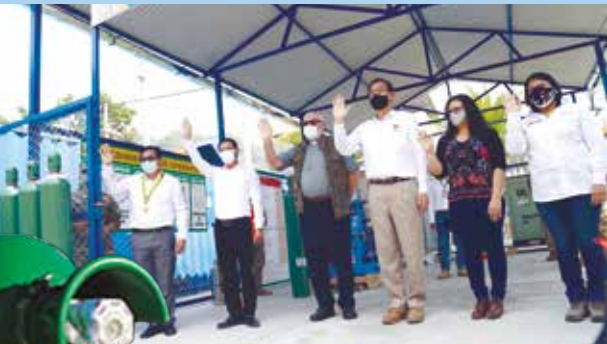
Expresidente Vizcarra asistió a la inauguración de una de las plantas en Junín.