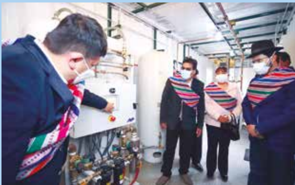
»» Tarma también cuenta con su propia planta para pacientes de esa provincia.