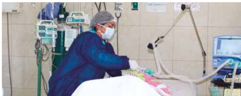
➤Las camas UCI implementadas cuentan con todo el instrumental médico.

D urante el pico de la pandemia por el Covid-19, la falta de camas de cuidados intensivos en todo el país se hizo evidente, saturando la mayoría de hospitales regionales y obligando a los pacientes a acudir a las clínicas privadas para recibir ventilación mecánica.