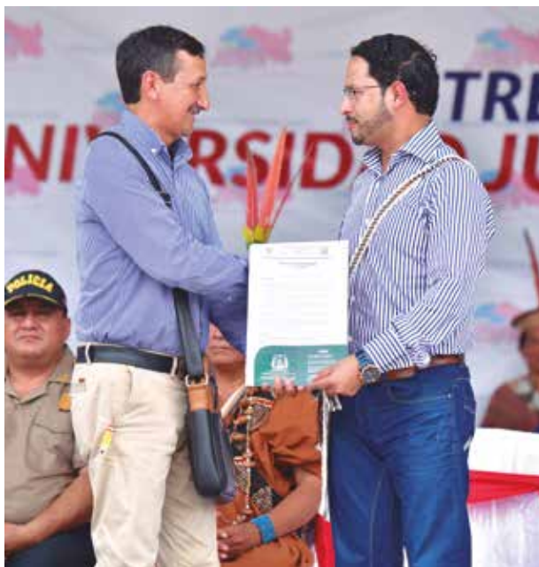
»»Autoridad regional y local firmaron convenio de apoyo específico.