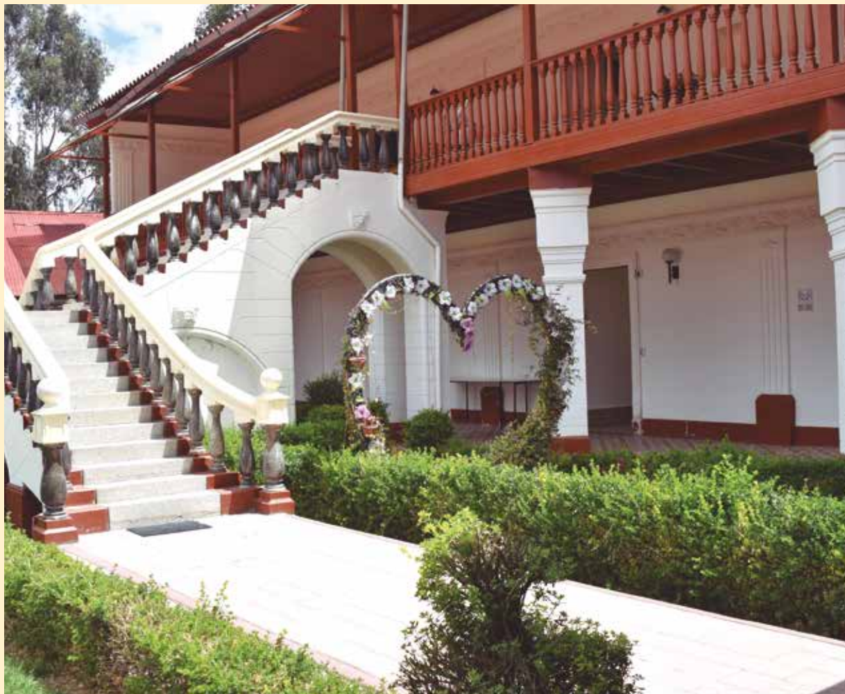
»» La Colombina es uno de los centros de asistencia temporal en Huancayo.

JUNÍN CUENTA CON OCHO LOCALES TEMPORALES GRATUITOS