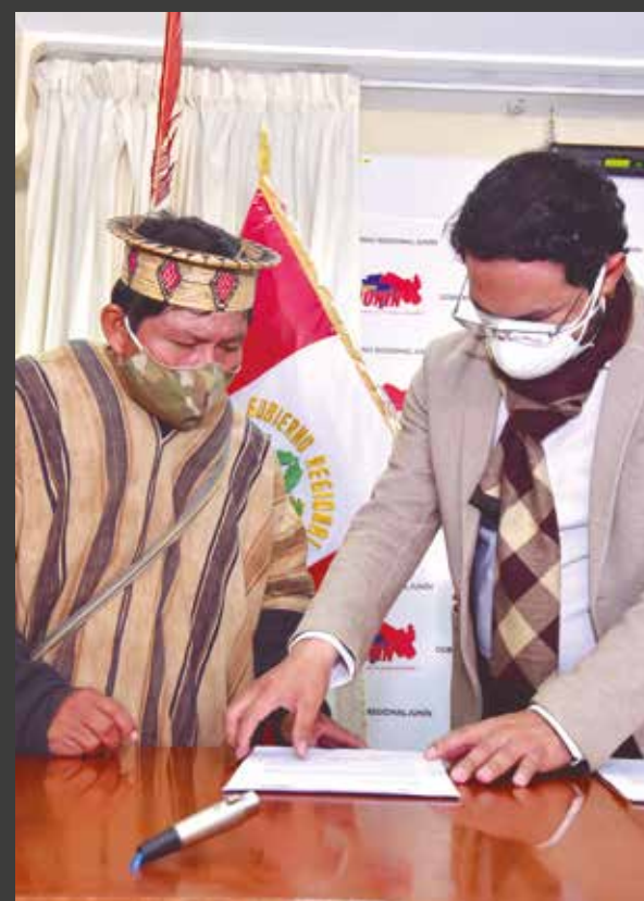
➤Comunidades de la Selva Central tienen numerosas vías troncales deterioradas.

das a la agricultura y los servicios turísticos.