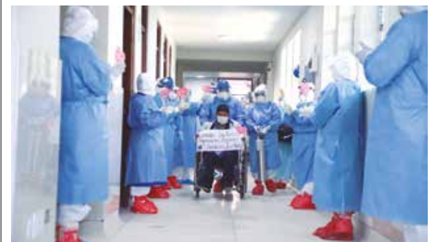
➤Cada alta es celebrado por todos.

Estos recursos permitirán para la contratación de recursos humanos, que constan de 15 médicos intensivistas, ocho enfermeros con estudios en emergencia o intensivistas y ocho técnicos en enfermería. Asimismo, para la adquisición de equipos de protección personal (EPP) e insumos médicos.