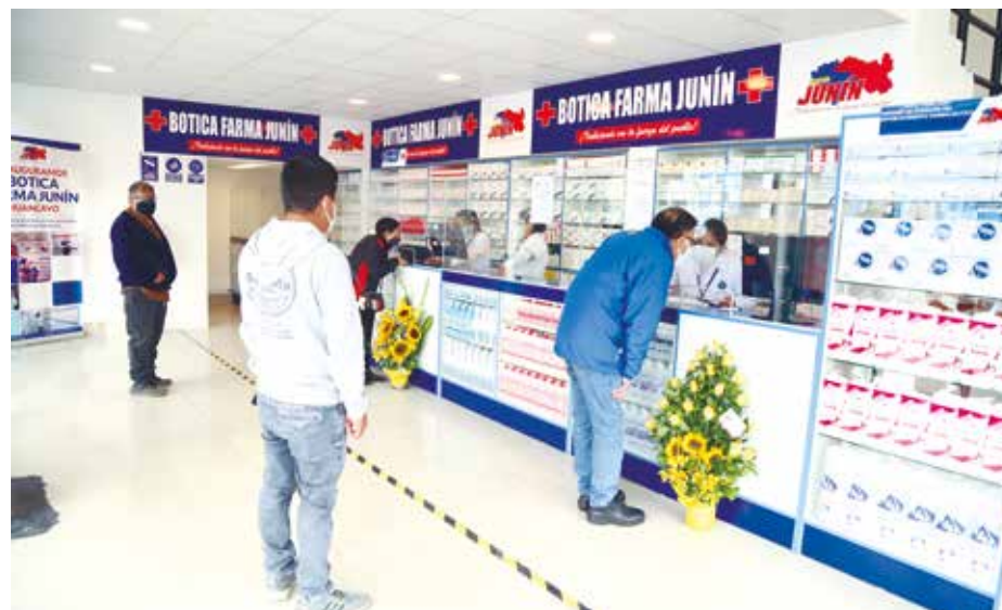
»Farma Junín expendirá medicamentos a precios sociales en toda la cadena.

La región ya cuenta con 11 ESTABLECIMIENTOS DE ESTE TIPO