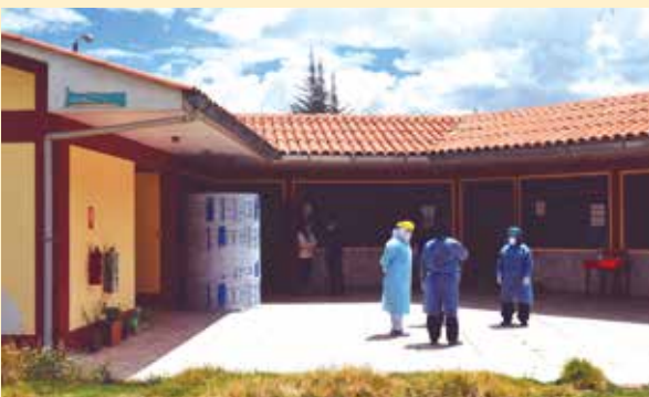
»» Pacientes reciben seguimiento permanente del personal médico.

RECIBEN ATENCIÓN MÉDICA, medicinas, alimentación y asistencia psicológica