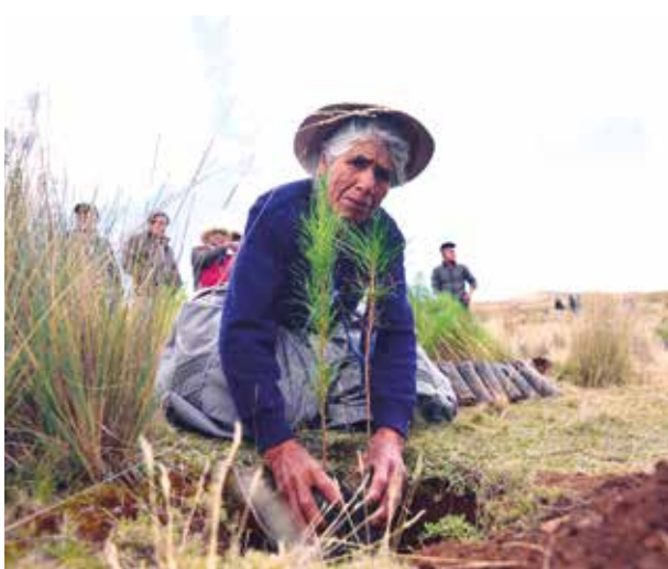
➤Un ambicioso plan de reforestación tiene planificado el gobierno regional.

“Sembremos oxígeno para cosechar vida”, es el lema con el cual el Gobierno Regional Junín (GRJ) a través de la Dirección Regional de Agricultura Junín (DRAJ), dio inicio a una campaña de reforestación intensa en las nueve provincias que busca recuperar los territorios deforestados y pro-