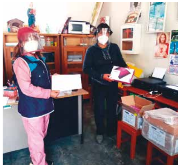
»La Dirección de Educación destinó recursos para las tablets de los escolares.

El presupuesto transferido corresponde a los gastos que se iban a ejecutar en las clases presenciales, suspendidas este año por la emergencia sanitaria.