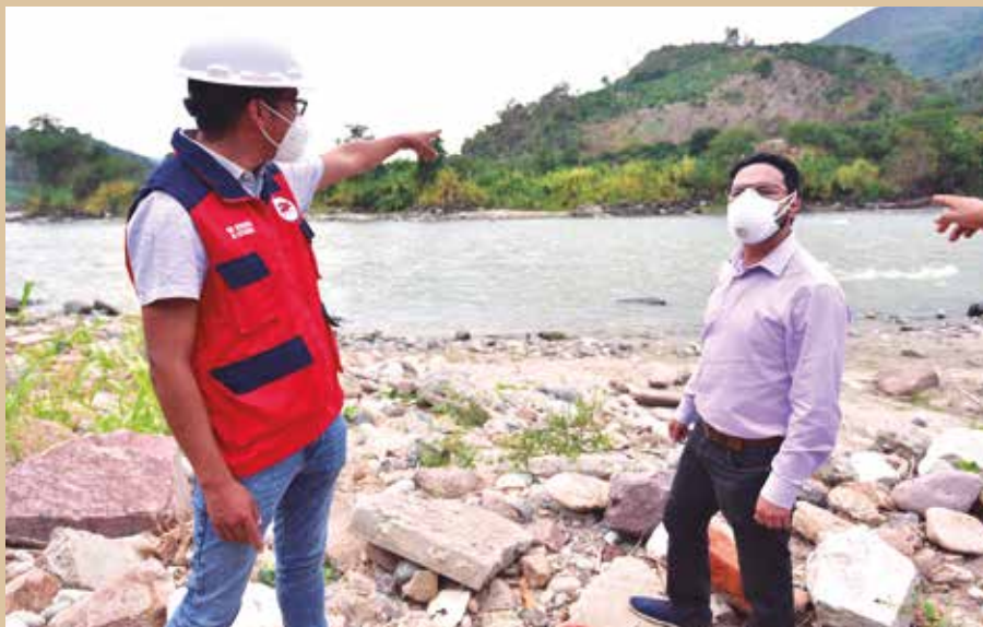
➤ Puente Noruega en Perené permitirá extraer frutales de la Selva Central.