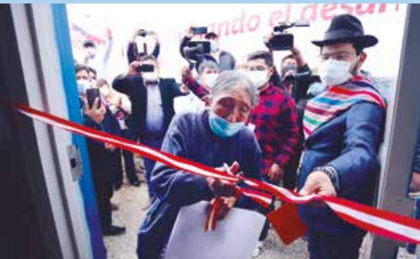
»» Gobernador regional participó activamente en la obtención de estas plantas.