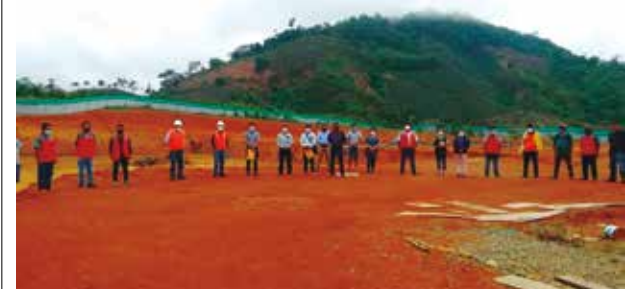
➤Avanzan con trabajos del cerco perimétrico.