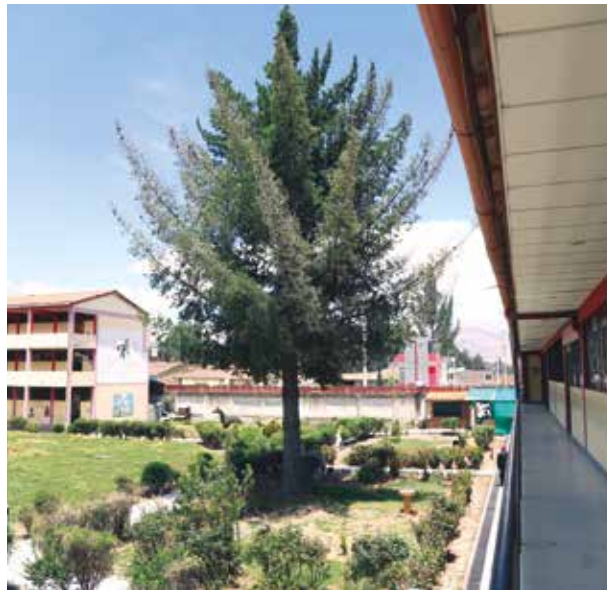
»El antiguo local será convertido en una moderna infraestructura.

ser un privilegio de pocos, sino un derecho de todos y en igualdad de condiciones. Las nuevas infraestructuras educativas de estos cuatro emblemáticos colegios ya no son solo promesas de campaña o de gestión, ahora es una realidad gracias a las gestiones intergubernamentales con las autoridades locales”, manifestó el gobernador Fernando Orihuela.