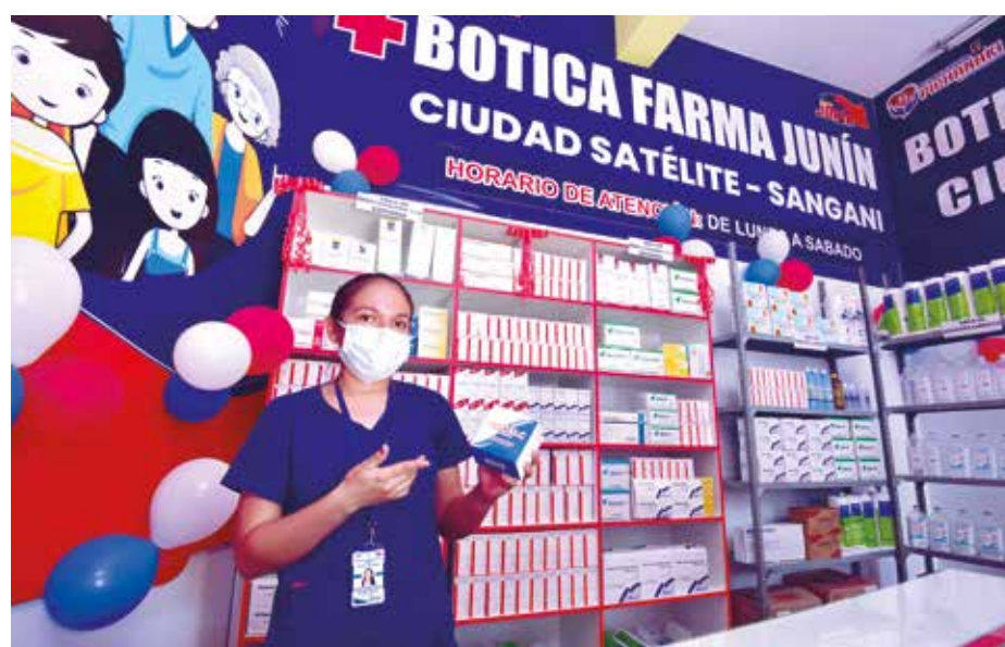
»El objetivo de Farma Junín es romper el monopolio existente de las farmacias.

E n respuesta a la gran concentración del mercado de medicamentos y la especulación de costos durante la pandemia del Covid-19, el Gobierno Regional Junín (GRJ) inauguró once boticas institucionales Farma Junín, donde una mascarilla quirúrgica de tres pliegues cuesta 15 céntimos o el litro de alcohol 7 soles.