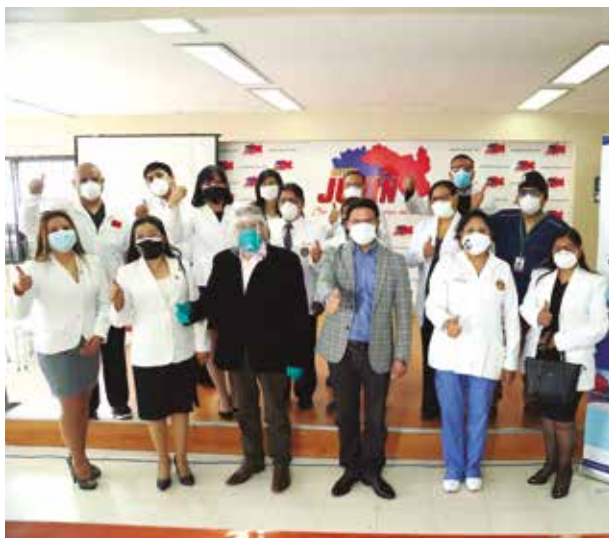
»»Junín es una de las regiones con residentado médico en varios hospitales.