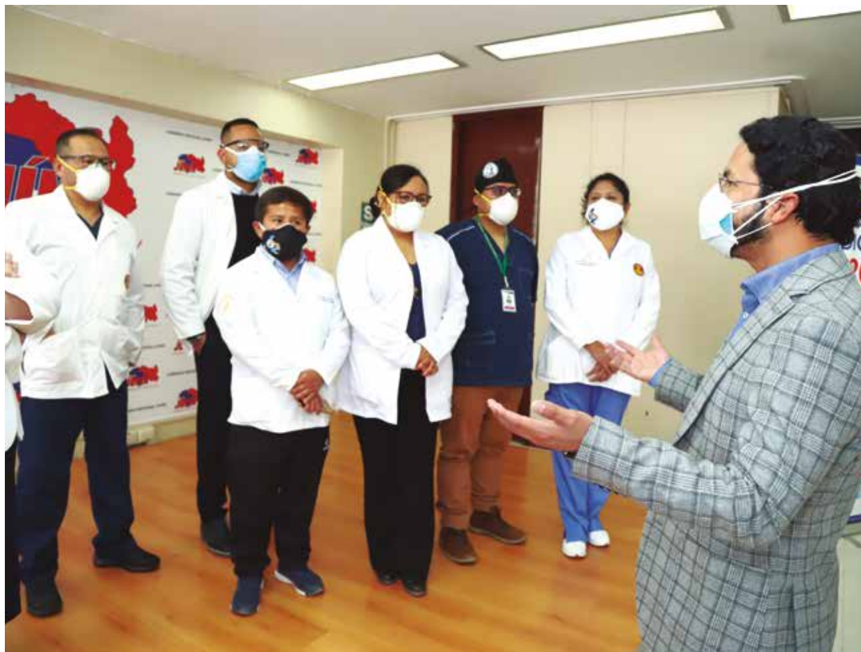
»»Gobernador presentó a los médicos que inician su formación especializada.