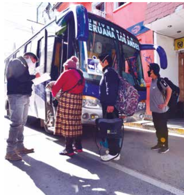
➤ Ciudadanos varados fueron regresados desde diversas regiones del país.

El Hospital Regional de Emergencia Covid-19