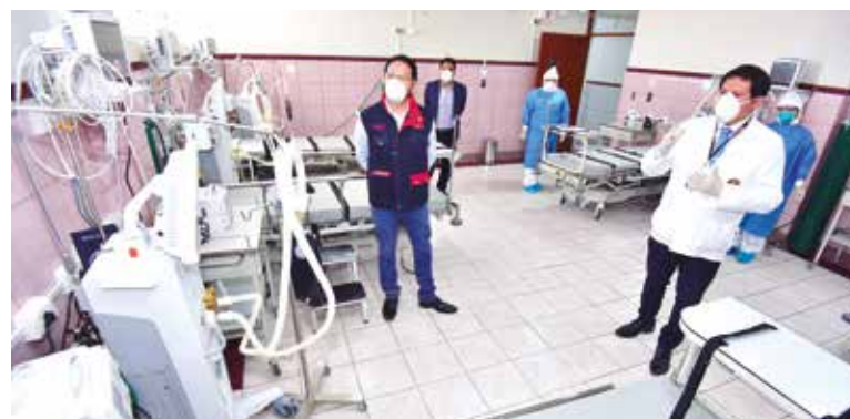
➤El gobernador regional se encargó de supervisar el equipamiento del nosocomio.

Esta decisión fue contemplada en el plan de reorganización del sector