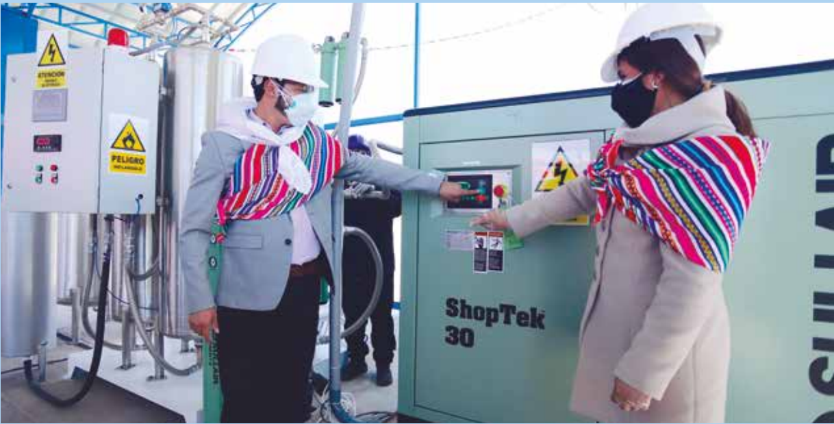
»» Junín es una de las pocas regiones que tiene esta planta en todos sus hospitales.