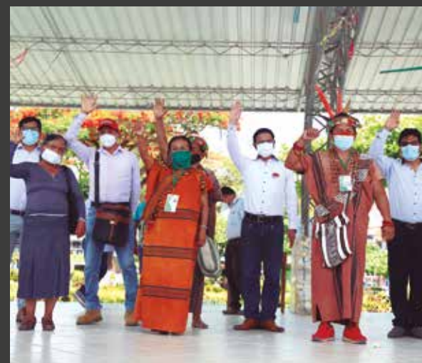
➤Dirigentes vecinales destacaron acción del GRJ, pues mejorarán su transitabilidad.

Según sostuvo el gobernador, Fernando Orihuela, una de las políticas del GRJ es mantener los caminos estables para brindar una mejor transitabilidad a la población y al sector productivo, más aún en esta época de pandemia del nuevo coronavirus donde es importante generar las condiciones necesarias para la reactivación de la economía de las familias de Selva Central, en su mayoría dedica-