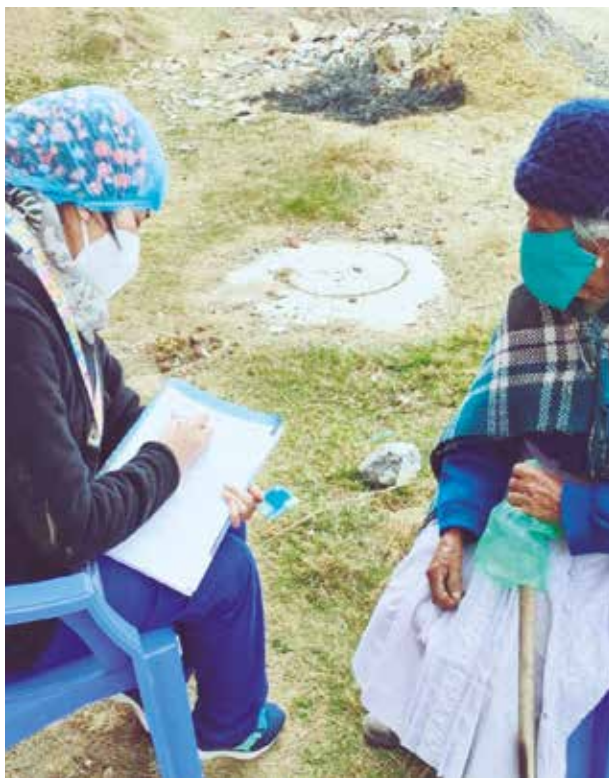
➤ Se conformaron más de 80 equipos de seguimiento.