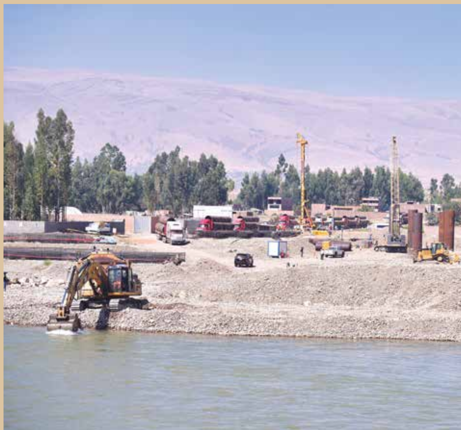
➤ Mediante fundas metálicas se vienen colocando 96 pilotes en el Comunero II.

CONVENIO SIMA. En otro momento, la autoridad regional señaló que en el marco del convenio N° SP-2019-010-A con SIMA están en la fase final la reformulación de los expedientes técnicos de los puentes Comunero III (Cantuta) que se edificará sobre el río Mantaro y unirá los distritos de Pilcomayo