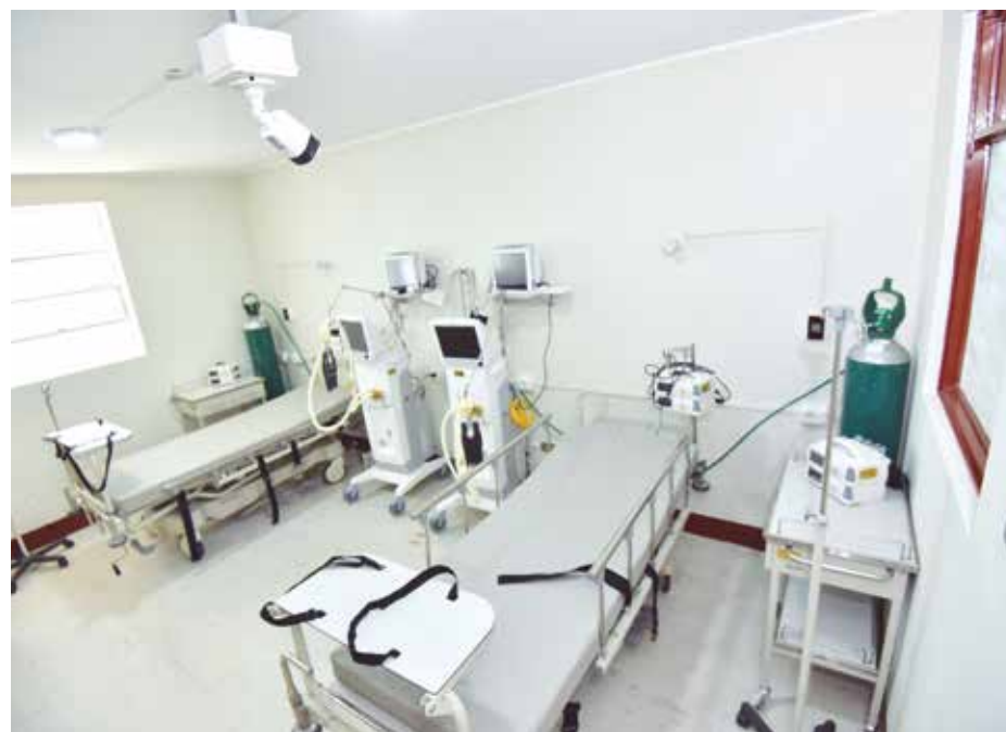
➤El hospital Daniel Alcides Carrión cuenta con 160 camas totalmente equipadas.

Cabe destacar, durante el momento pico de la pandemia, el total de camas con las que contaba el hospital fueron copadas por pacientes con Covid-19, por lo que se registró una alta rotación.