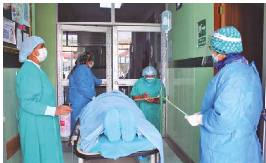
»Cumplir metas permite beneficios para el establecimiento y personal.

eficiencia, y preste efectivamente servicios de calidad en materia de salud al ciudadano, a través de una política integral de compensaciones y entregas económicas” al personal de los establecimientos de salud, redes y microrredes, que hayan cumplido sus metas institucionales.