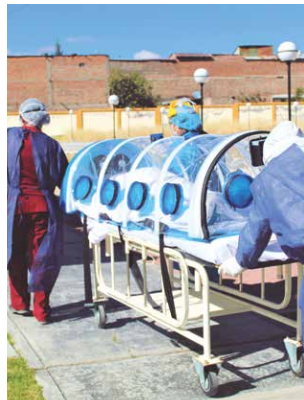
»El Hospital de Tarma también alcanzó una alta meta.

de mejora que debían cumplir la Dirección Regional de Salud (Diresa), redes y establecimientos de salud para hacerse acreedor del bono, entre ellas: reducción de anemia, vacunas completas a niños menores de 15 meses, tratamiento de tuberculosis, disponibilidad de medicamentos esenciales, fortalecimiento de las referencias y contrarreferencias, implementación de centros de salud mental comunitarios, telemedicina y ejecución presupuestal de más de 90%.