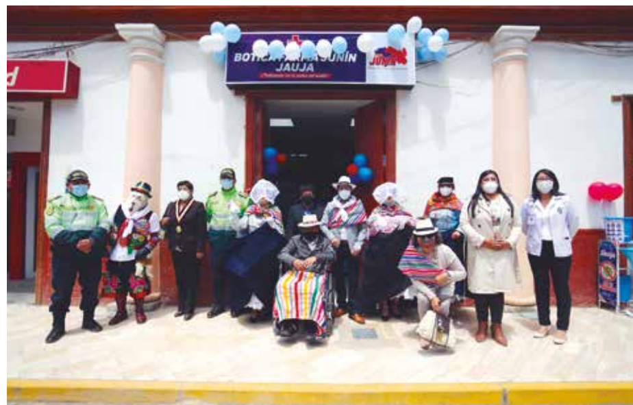
»Jauja también cuenta con una sede de Farma Junín para atención general.

Otros medicamentos genéricos que se pueden adquirir en Farma Junín y a bajo costo son el blíster (10 tablas) de paracetamol a 30 céntimos, amoxicilina a 1 sol, prednisona a 50 céntimos y dexametasona a 50 céntimos.