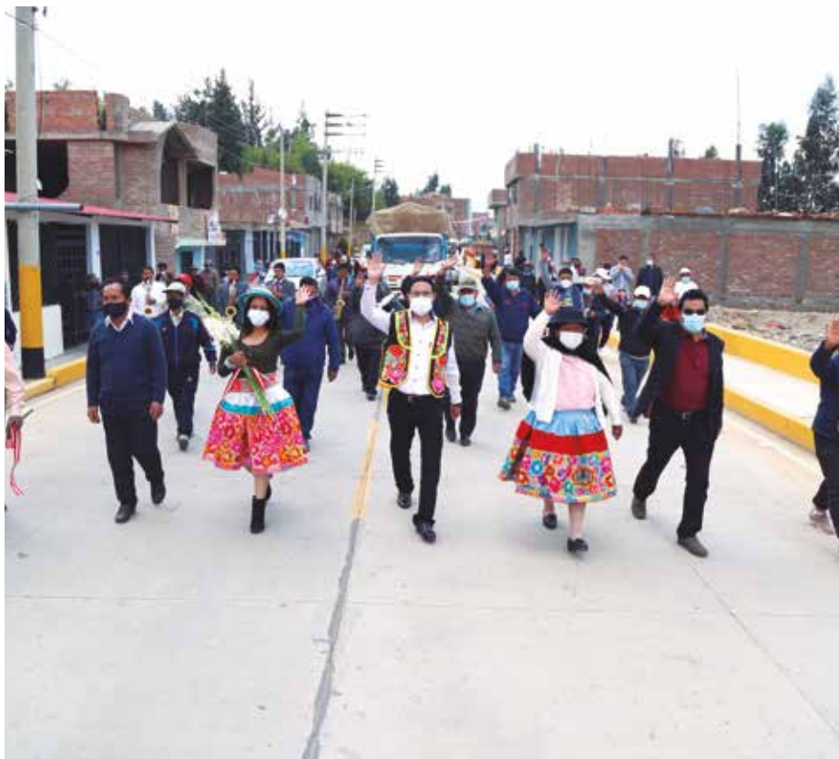
➤ Vecinos los son más felices con la inauguración de la vía Palián-Vilcacoto.

Vecinos ahora pueden llegar a Huancayo en 20 minutos y no en una hora