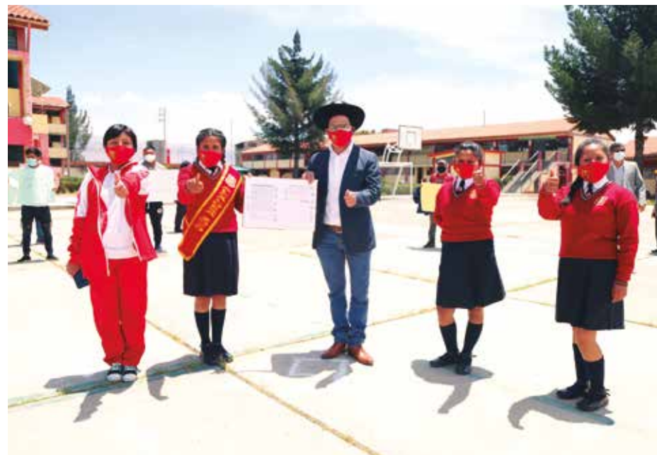
»El Colegio Túpac Amaru de Azapampa será construido por el Pronied.

5 MIL ESTUDIANTES mejorarán condiciones de aprendizaje en Junín, Concepción, Chupaca y Chilca