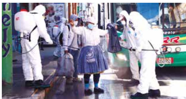
➤ Traslados cumplieron los protocolos de bioseguridad para evitar contagios.

VIAJES SE REALIZARON DESDE TACNA, PUNO y ciudades del norte del país