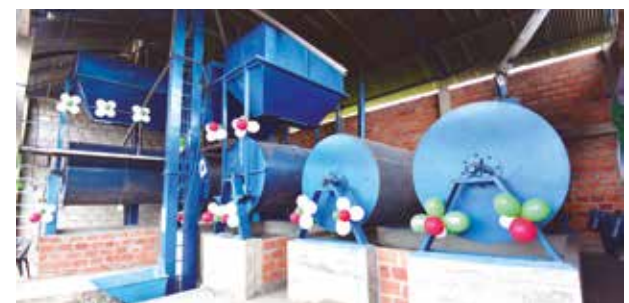
➤GRJ les entregó equipamiento para procesar su producción.

permitido continuar con la producción y procesamiento del café aún en plena cuarentena por el coronavirus. Sin ello, hubiéramos tenido que trasladar nuestros quintales de café directamente al mercado o hasta plantas secadoras privadas, lo cual hubiese sido imposible por el impedimento de movilización y que nos hubiese generado grandes pérdidas económicas”, explicó.