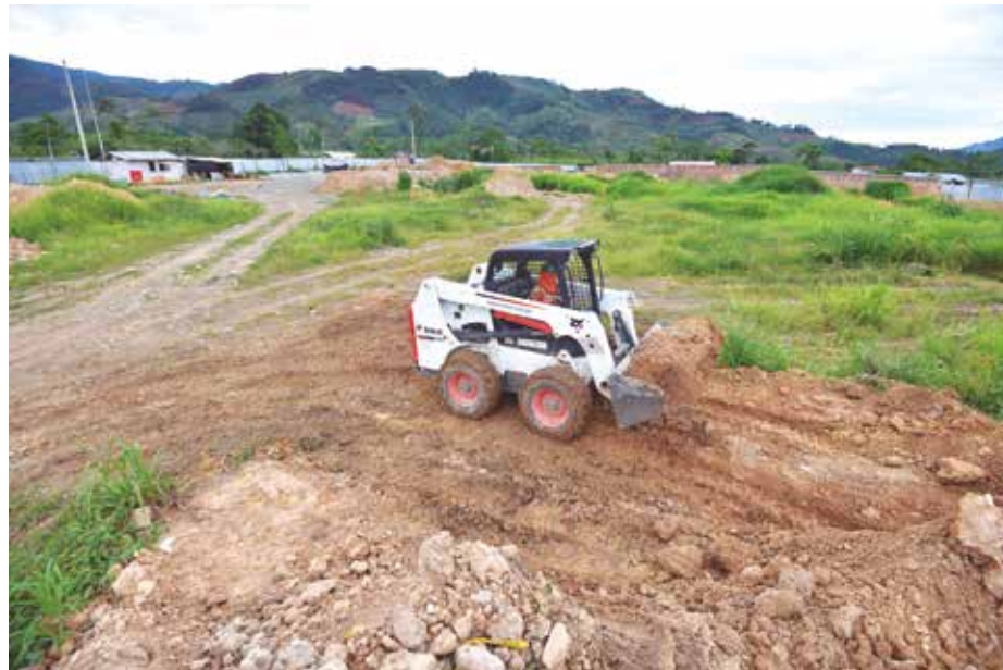
➤GRJ cumplió con la entrega del terreno para la construcción del hospital.

REUNIÓN. Precisamente, para esclarecer los motivos de la reubicación, el vicegobernador Clever Mercado y funcionarios del GRJ sostuvieron una reunión técnica con siete burgomaestres de la Mancomunidad Norvraem, quienes suscribieron un acta donde exigen que la construcción continúe en Río Negro, en vista que también ya se inició