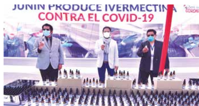
➤ Junín fue una de las primeras regiones en producción a gran escala.

“Así evitamos que la enfermedad evolucione y muchos pacientes lleguen a hospitalización o ventilación mecánica”, sostuvo la autoridad.