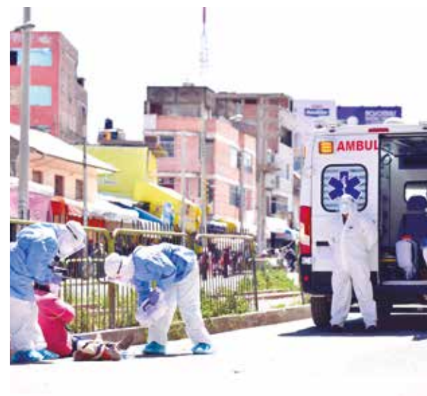
➤ La región pionera al contar con tres bases de SAMU.

Puerto Ocopa, en cuyas rutas se hallan los primeros distritos beneficiarios. Las personas que requieran atención médica deberán comunicarse con la línea gratuita 106 de cualquier operador de telefonía para recibir atención pre hospitalaria y de ser necesario trasladado a un establecimiento de salud para continuar con el tratamiento especializado.