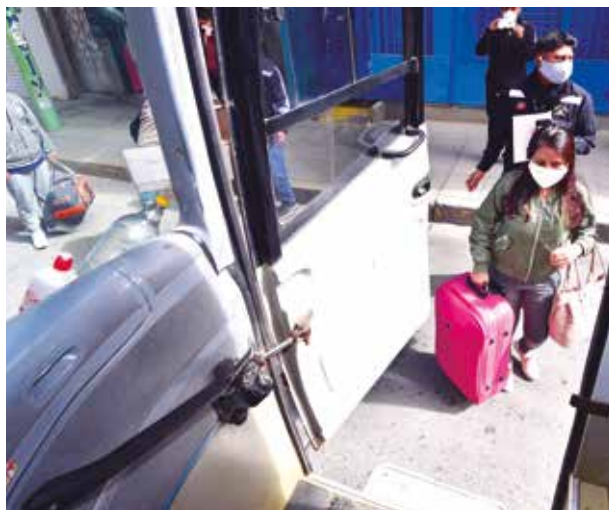
➤ Jóvenes que arribaron del extranjero también fueron trasladados por el GRJ.