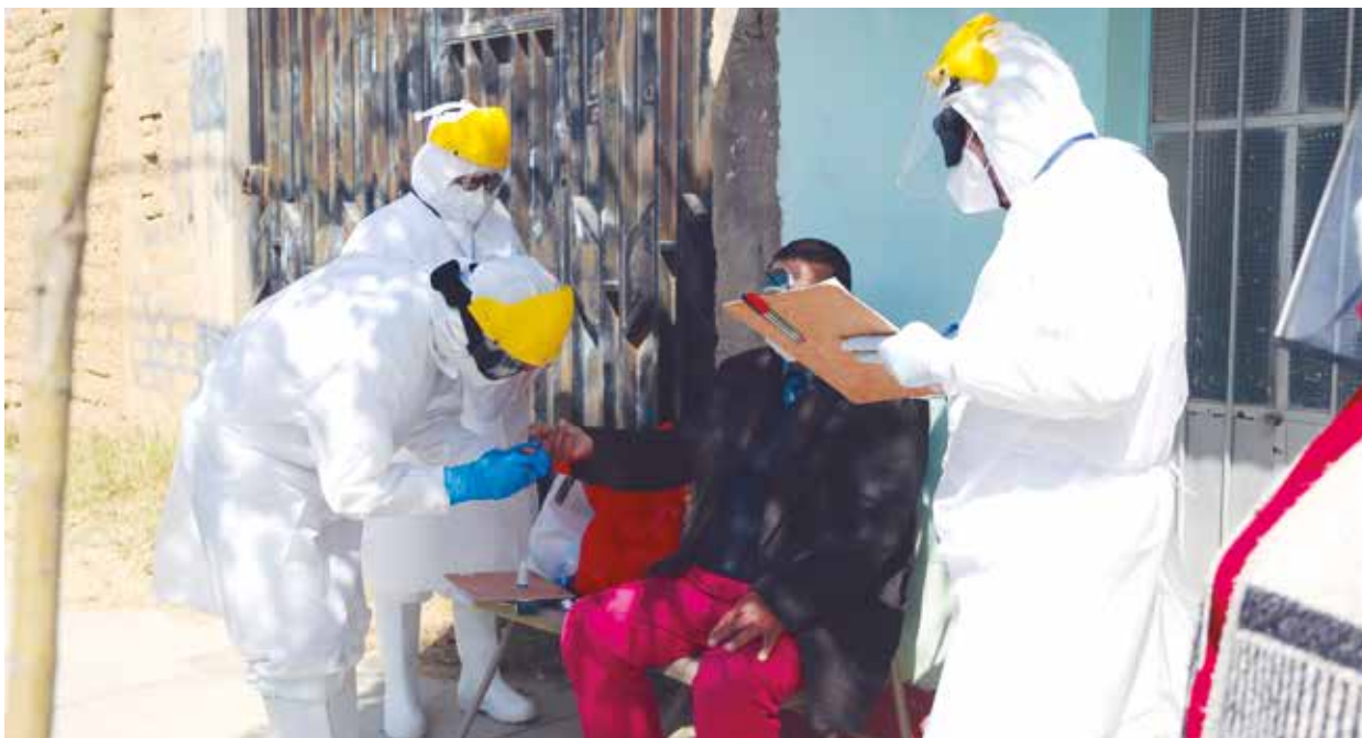
➤ El tamizaje de las brigadas de Médicos de Familia evita el colapso de hospitales.

TRATAMIENTO TEMPRANO logra evitar el colapso de sistema sanitario