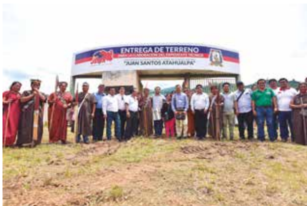
»»La casa superior de estudios tendrá una infraestructura moderna.

“Firmamos el convenio marco y trabajamos el acuerdo específico que contempla la creación de la facultad de Medicina Humana y producto de ello nos están transfiriendo la unidad ejecutora para los estudios de perfil, expediente técnico y su posterior ejecución con una inversión aproximada de 80 millones de soles”, afirmó el gobernador Fernando Orihuela.