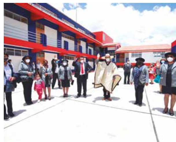
»»El plantel albergará a centenares de alumnos cuando regrese la modalidad presencial.

El gobernador señaló que el acceso a la educación o la salud no deben ser condicionados por aspectos geográficos o socioeconómicos. En esa línea, agregó que su administración continuará impulsando proyectos