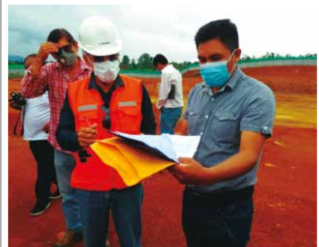
➤Trabajos tienen un plazo de ejecución de 540 días y costarán 102 millones de soles.

Según el expediente técnico, contará con tres pabellones con servicios de un hospital de categoría 2-I con 72 camas y 10 cunas.