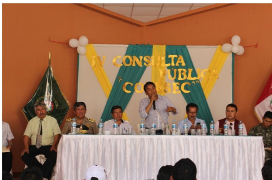
Presidente del CORESEC – JUNIN dando las palabras de Bienvenida