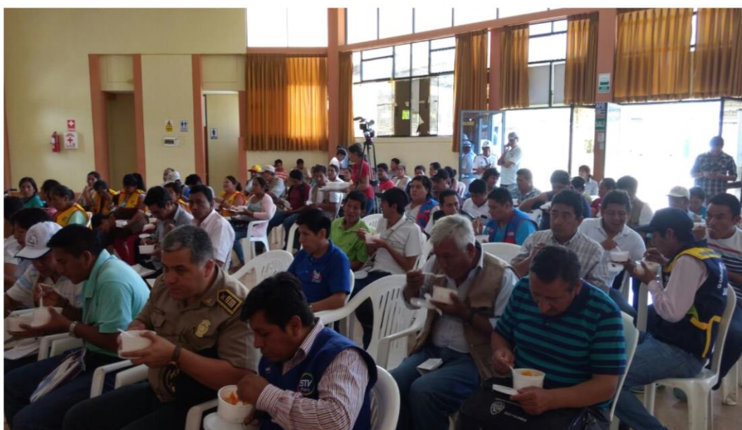
Asistentes a la IV Consulta Pública Regional de Seguridad Ciudadana