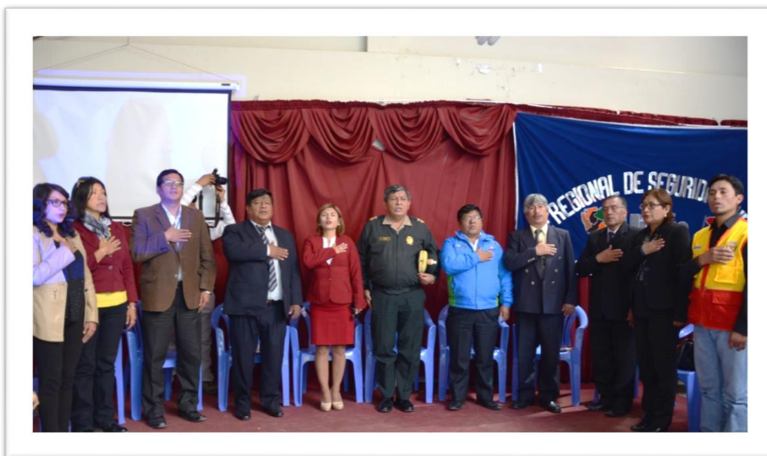
Inauguración de la III Consulta Pública Regional de Seguridad Ciudadana