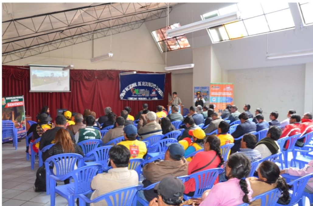
Asistentes a la III Consulta Pública Regional de Seguridad Ciudadana en la Provincia de Chupaca