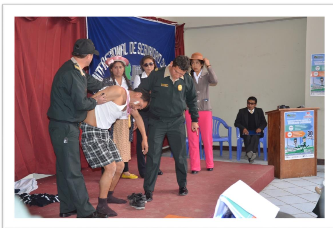
Capitan Reyes y Técnico Cuba conforman parte del Taller