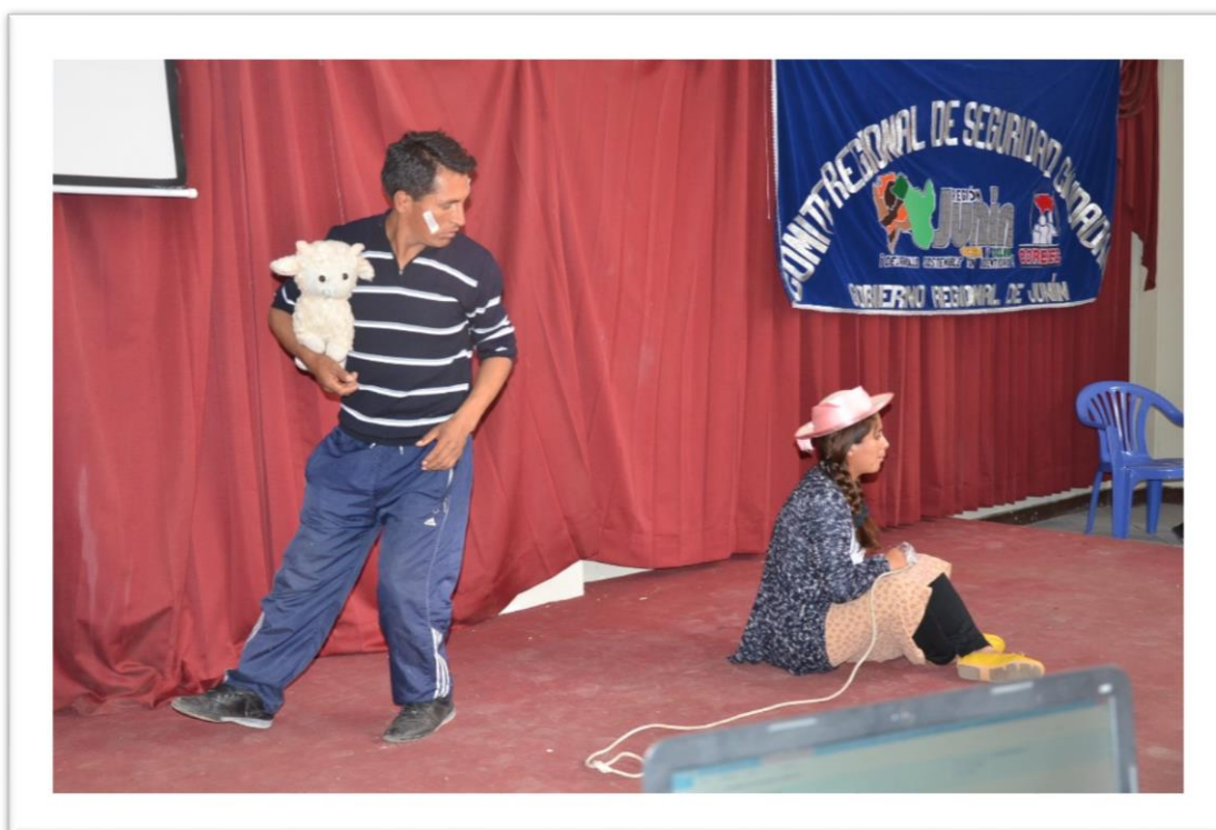
Escenificación del Taller de Teatro de la PNP