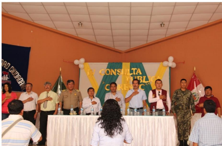
Miembros de CORESEC – JUNIN entonando el Himno Nacional