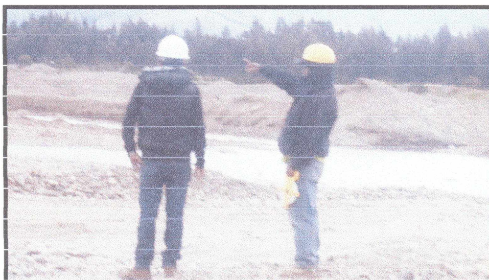
FOTO N°02: SE VERIFICO CON EL MAESTRO DE OBRAS LAS PARTIDAS EJECUTADAS