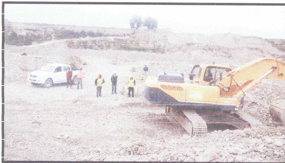
FOTO N°04: UNA EXCAVADORA ESTABA DE PARA POR QUE SUFRIO UN DETERIORO