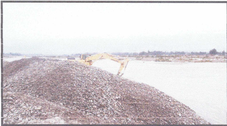
FOTO N°06: SE ESTA DESCOLMATANDO A UNA PROFUNDIDAD DE 1m EN TODO EL CAJON HIDRAULICO