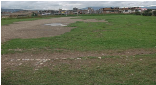
MONTICULOS DE HIERBA