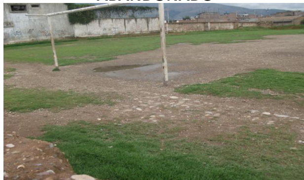
PUERTA POSTERIOR EN MAL ESTADO COMPLEJO 3 DE OCTUBRE