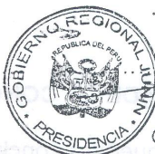
Vladimir Roy Cerrón Rojas Presidente Gobierno Regional Junin

GOBIERNO REGIONAL JUNIN Lo que transcribo a Ud. para su conocimiento y demás fines,