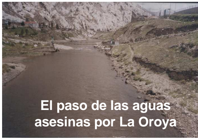
El paso de las aguas asesinas por La Oroya